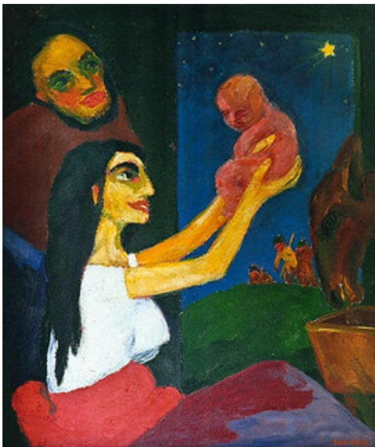
Heilige nacht, Emil Nolde (1867-1956)

Zaterdag 24 december 2022 – aanvang: 22.00 uur