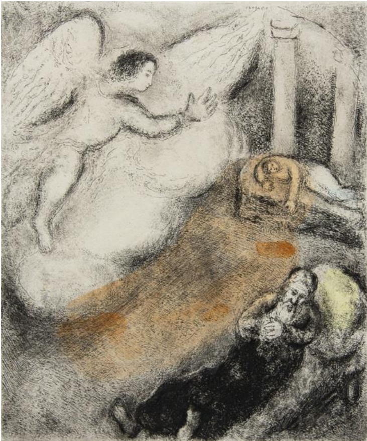
Samuel - Marc Chagall (1887-1985)