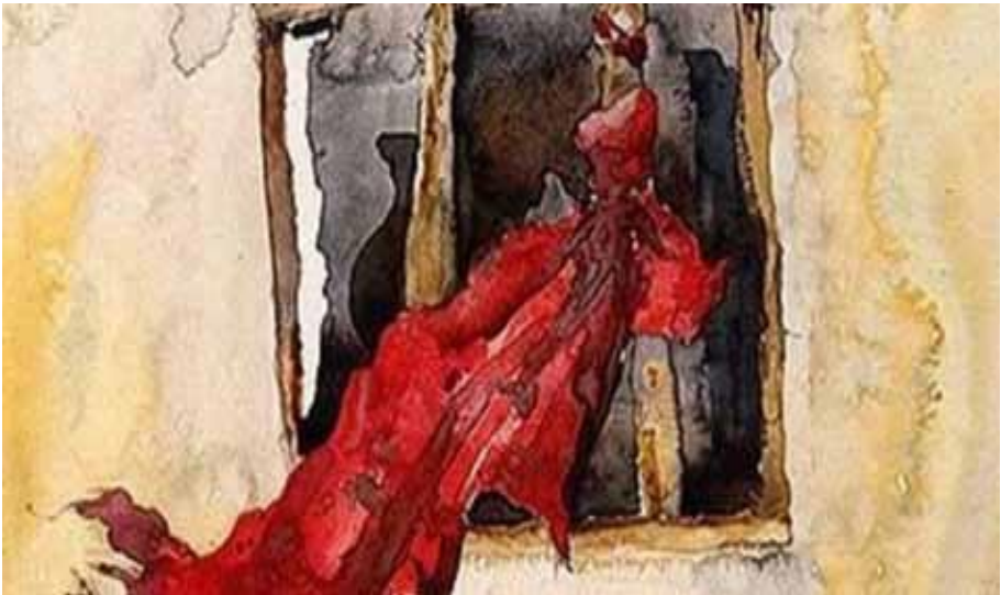
Rachab en de verspieters